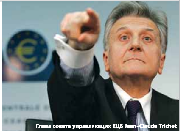
Глава совета управляющих ЕЦБ Jean-Claude Trichet

По мнению Жана-Клода Трише, главы совета управляющих ЕЦБ, данное решение отражает усиление скрытых рисков для ценовой стабильности в среднесрочной перспективе, которое обнаружили во время проведения как экономического, так и финансового анализа. Формально инфляция в зоне евро стабильна: последние два месяца рост потребительских цен держится ниже установленного ЕЦБ лимита в 2% годовых. Однако, цены производителей растут, что неизбежно отразится на потребительских ценах. По словам Жана-Клода Трише, инфляция в зоне евро снизится в ближайшие месяцы, но значитель-